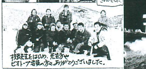
校長先生はじめ、先生方や ピトア委員の方々、ありがとうございました。