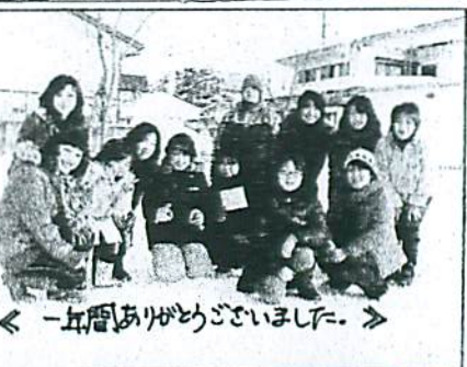
← 一年間ありがとうございました。 →