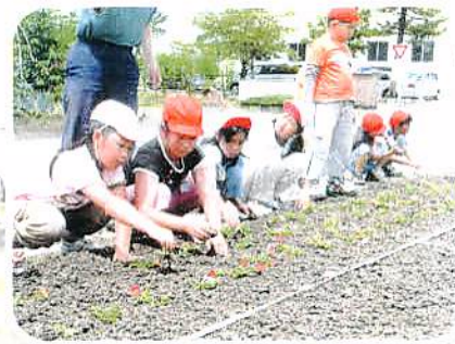
◆フラワークラブとの花植え