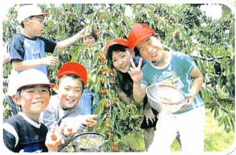
◆さくらんぼの収穫