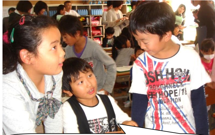
かけ算のきまりを使いながら、みんなで考え合っ て4×99の問題に取り組みました。

いろいろな意見を出し合いながら、友達同士説明しあってみんなで問題を解決しました。