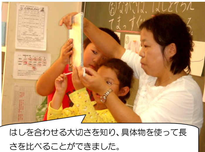
はしを合わせる大切さを知り、具体物を使って長さを比べることができました。