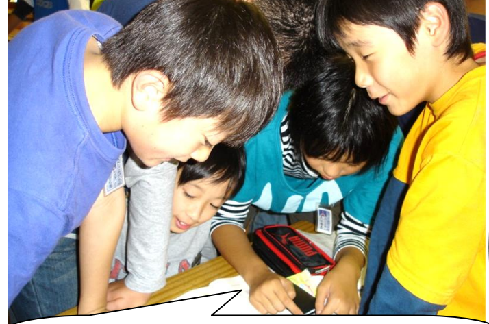
円の面積の公式をつかって、むずかしい形の面積も友達同士教え合いながら考えました。

「こんにちは〜」玄関前や受付では、6年生の子どもたちが、さわやかな笑顔とあいさつで、来校者を迎えました。