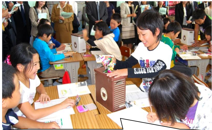
あめ取りゲームをしながら、グループごと意欲的に平均をもとめていました。