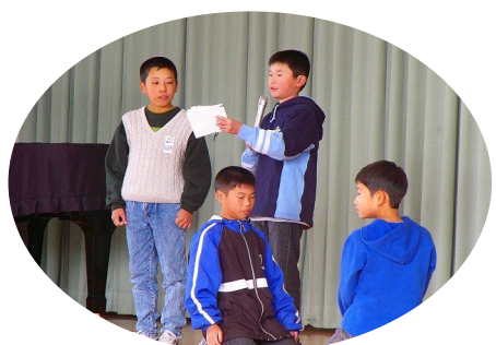
クローバー集まりゲームの 説明をする五年生