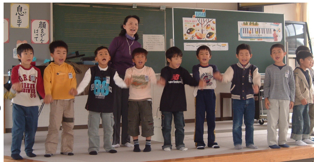
一年生 音楽の授業