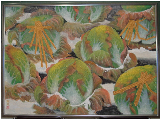
古城英夫氏(島5)より絵画を 寄贈していただきました 「8免 秋」 第52回県美展入選作品