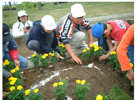
最上川ふるさと総合公園に植栽 6月13日、花咲かフェア会場の学校花壇に、5年生が植栽を行った。自分たちでデザインした「51」の文字を、花で描いた。

5月3日の「南部まつり」で南部小「ぶちあわせ太鼓」の発表がありました。(南部公民館グラウンド) 年々6年児童から5年児童への教え合いで引き継がれています。6年生は、これが最後の演奏でした。今後は、寒河江まつりなどで、5年生が演奏します。