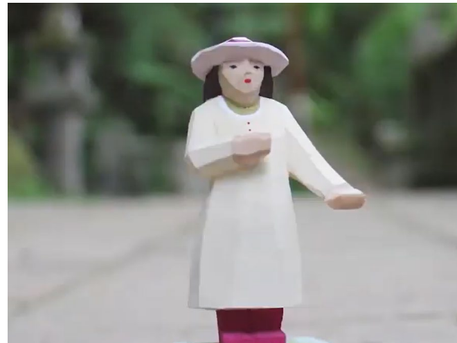
上田市シティプロモーション 「うえだ こっぱなし ～鹿教湯温泉文殊堂編～」