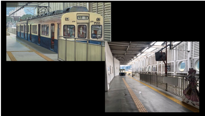
サマーウォーズの聖地と 上田の観光名所の紹介