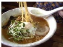
日付: 2000/09/08 勘鳥居にて

分県: 東根温泉 花の湯ホテル 湯の駅 湯郷市 (登録日: 2000/09/08 更新日: 2001/12/15)