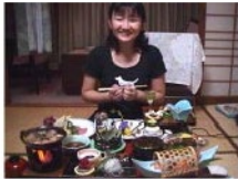
日付: 2000/09/07 花の湯ホテルにて

分県: 東根温泉 花の湯ホテル 湯の駅 湯郷市 (登録日: 2000/09/07 更新日: 2001/12/15)