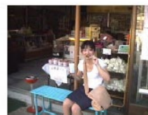
日付: 2001/07/30 蔵王温泉街にて

分標 (日帰り) 近畿の温泉 温泉の景 地域 山形市 (登録日: 2001/07/30 更新日: 2001/12/15)