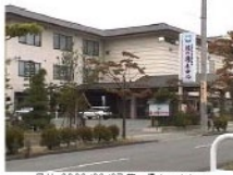
日付: 2000/09/07 花の湯ホテルにて

分県: 東根温泉 花の湯ホテル 湯の駅 湯郷市 (登録日: 2000/09/07 更新日: 2001/12/15)