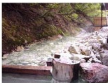
日付: 2001/07/30 蔵王大露天風呂にて

分標 (日帰り) 近畿の温泉 温泉の景 地域 山形市 (登録日: 2001/07/30 更新日: 2001/12/15)