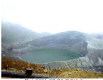
日付: 2001/07/30 お釜にて

分標 (日帰り) 近畿の温泉 温泉の景 地域 山形市 (登録日: 2001/07/30 更新日: 2001/12/15)