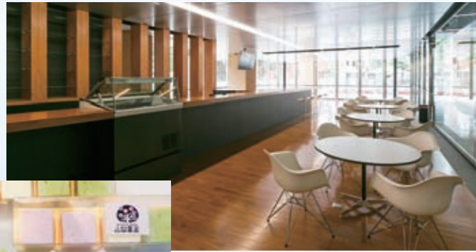
◀オリジナルスイーツの一つ「ギモーグ」。 フレッシュな風味ともっちりした食感が絶妙!