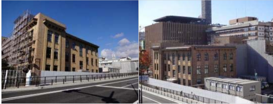
委員会室棟の改築工事を引き続き行っています。