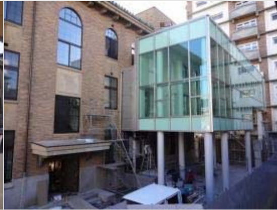
防災新館南側駐輪場の屋根等整備が完了しました。