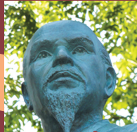
佐久間象山 (松代藩士)