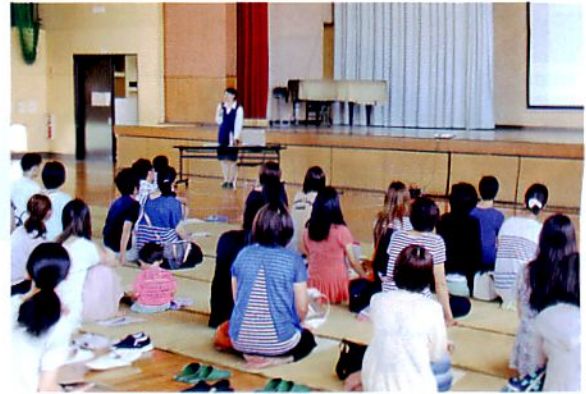
P T A 講演会 7/20(水)

主な活動は児童警察署の方をお呼びしてネットトランプから子どもを守ると題した教育講演会と、ま