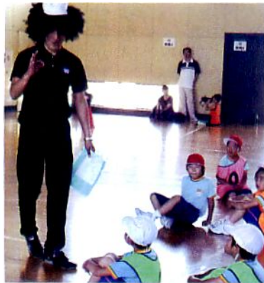
1学年の学年行事 6/11(土)

私がPTAの役員をしている理由は、は愉しいからです。愉しくないことは続かないのでやりません。PTAのおしごとのはほとんどがイベントの企画や運営です。今年も運動会や学年行事が愉しかったですよ。ね？「踊る阿呆に見る阿呆。同じ阿呆なら踊らな損損」愉しいイベントを一緒に踊りましょう！