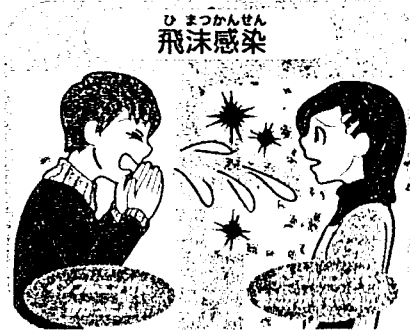
くしゃみやせきなどのしぶきで飛んだウイルスを吸い込む。