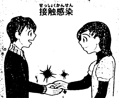
ウイルスのついた手や、その手でさわったものに触れる。