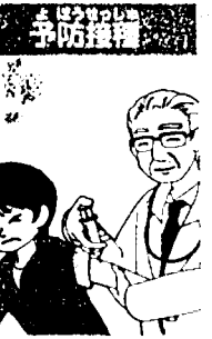
12月末ごろまでに、2回接種すると、効果が高くなるといわれています。