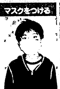
外出する前に、鼻と口をすっぽりおおうようにマスクをつけよう。