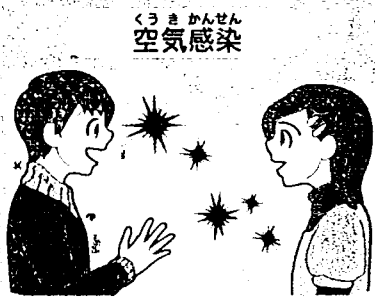
くしゃみやせきから出たしぶきの中にあるウイルスが目に見えない大きさになって、空気に浮かんでいるものを吸い込む。