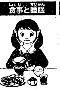
好き嫌いせずにバランスよく食べ、早寝早起きの習慣を。