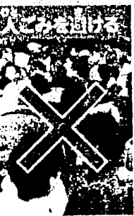
人が大勢集まる場所に行くことは、できるだけ避けよう。