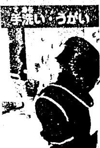
外から帰ったら、すぐに手洗とうがいをしよう。