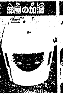
加湿器などを使って、部屋の空気を乾燥させないようにしよう。