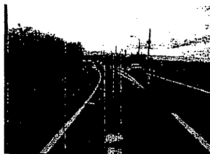
【Aの進行方向からの見通し】