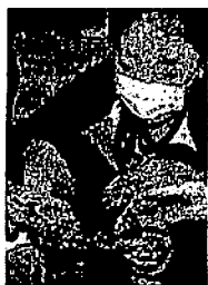
*歯型を見ています